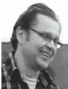
Reiner Schlestein www.prisma-glas.de