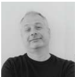
Jürgen Heinz www.atelier-juergenheinz.de