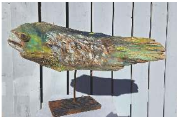
Holzskulpturen von Harald Böhm, www.boehm-bilder.de

Auch Brennholz dient als Maluntergrund. Auf den rauen, gewachsenen Oberflächen entwickeln sich kleine, eigenständige Kunstwerke, direkt, experimentell und mit Freude am Material.