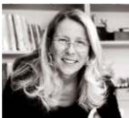
Anja Gensert www.galerie-gensert.de