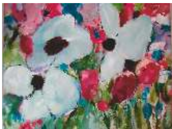
Helga Mayer Instagram helga_2016

Acrylfarben können nicht nur mit dem Pinsel, sondern auch mit dem Spachtel aufgebracht werden. Spachtel, Malmesser, Schaber und viele andere Utensilien ermöglichen unterschiedliche Strukturen, die lebendig wirken und für eine interessante Optik sorgen. Dabei können die Acrylfarben pur oder in Kombination mit Strukturpaste und Strukturgel verarbeitet werden. Schichten und Überlagerungen ergeben spannende Effekte.