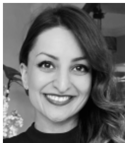
Nora Albrecht https://galerie31.de/