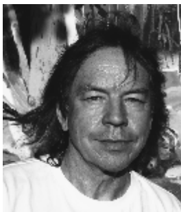
Harald Böhm www.boehm-bilder.jimdofree.com